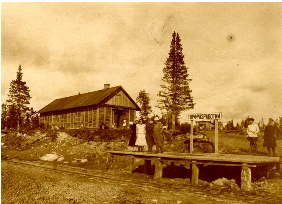
Фото № 7. Платформа лагерной командировки на Филимоновской ветке. Фото 1929 г.