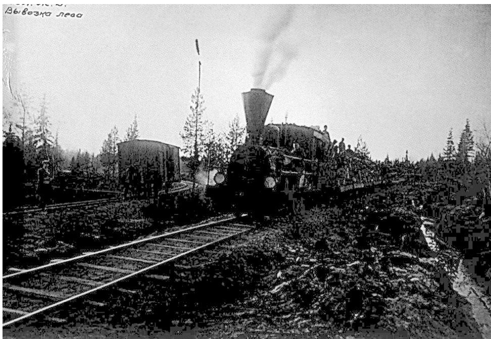
Фото № 9. Левая и правая ветки железнодорожной линии Перт-Портовая. Фото 1927 г.