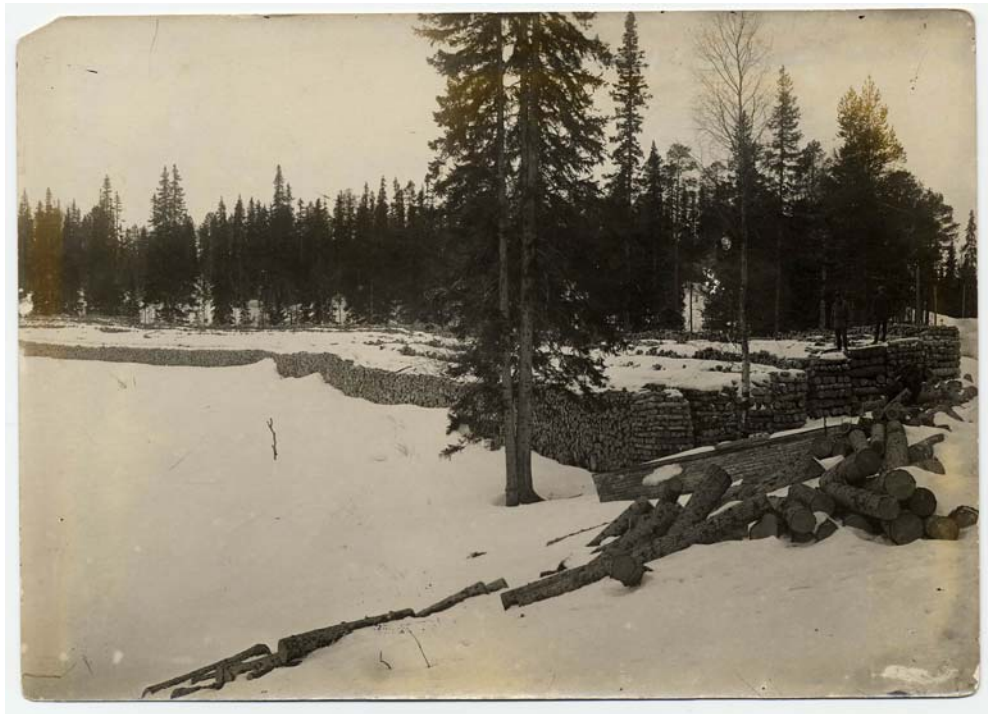
Фото № 10. Штабеля дров, подготовленные к вывозу по правой ветке Перт-портовая. Фото 1929 г.